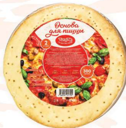
Заготовка для пиццы замороженная

Хлебобулочное изделие высокой степени готовности.