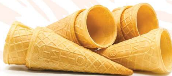
Вафельный рожок «Факел»