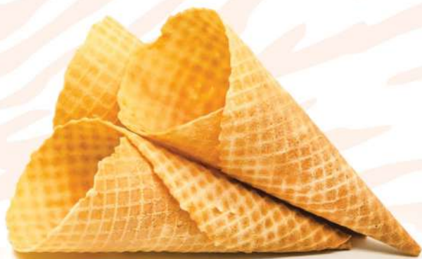
Вафельный сахарный рожок